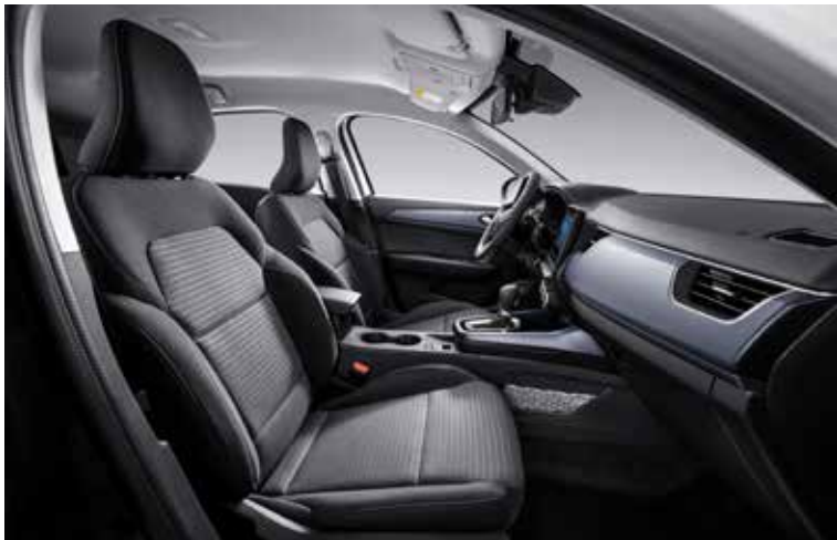
Arkana E-Tech Hybrid