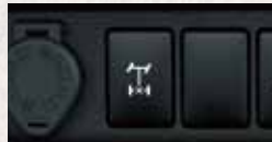
Bloqueo diferencial trasero (versiones 4x4).