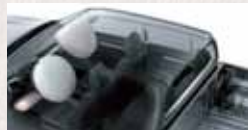
Airbags frontales (conductor y acompañante) y de rodilla (conductor).